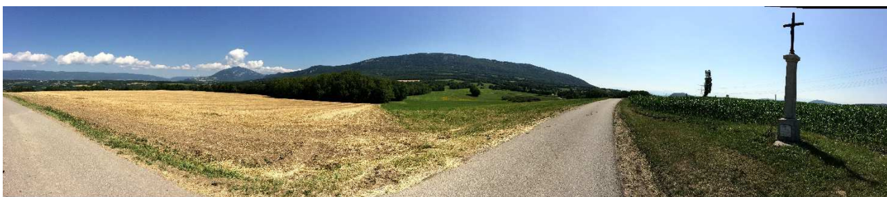
Le Vuache, depuis le plateau des Daines.