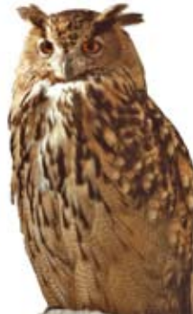
Hibou Grand Duc

Cette montagne offre un environnement remarquable grâce à une flore à la fois méridionale, continentale et jurassienne. La randonnée pédestre s'accompagne aussi de panoramas exceptionnels sur Genève, le Jura, les Alpes, le Mont Blanc, le lac Léman, le lac d'Annecy et le lac du Bourget.